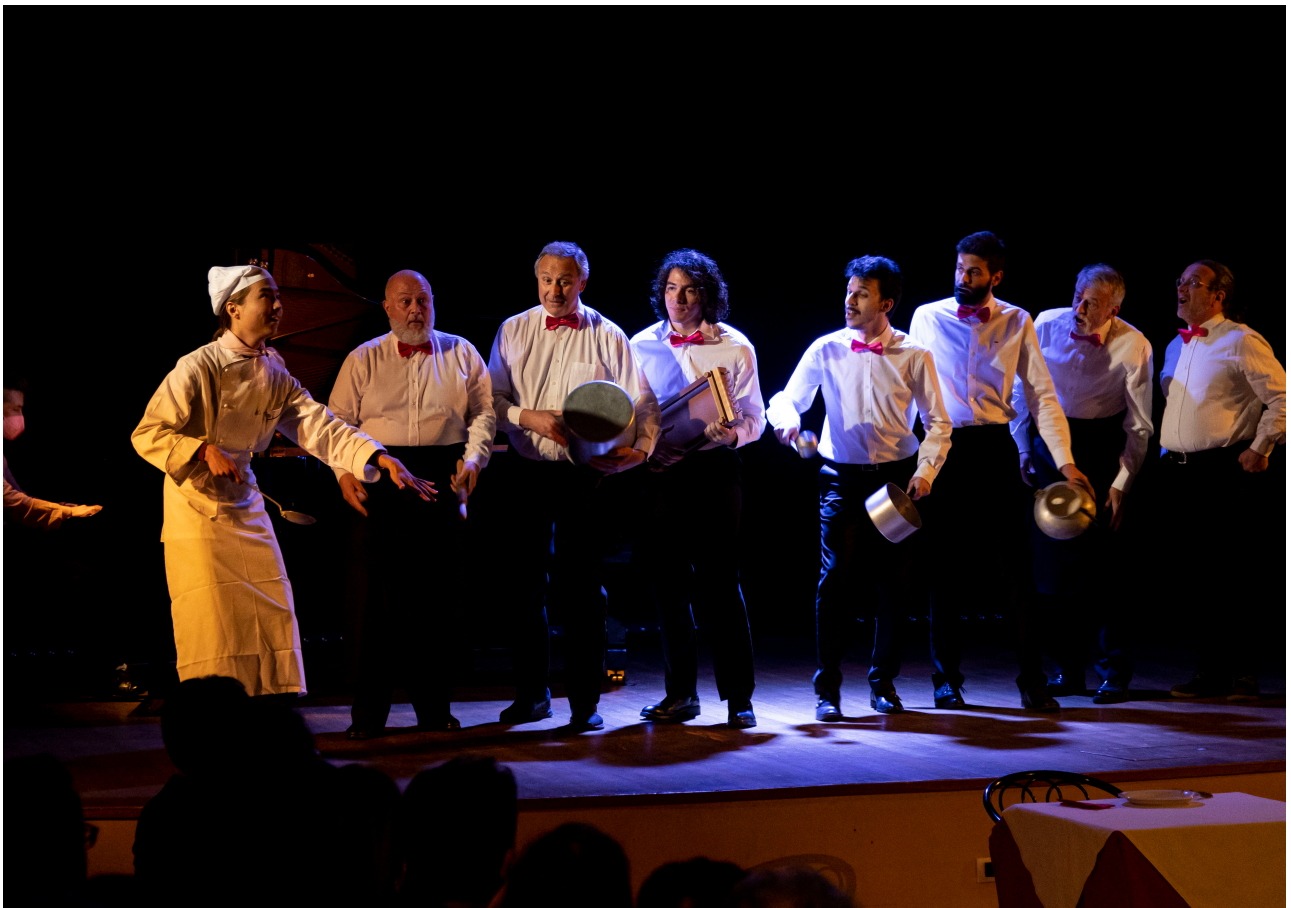
Il Barbiere di Siviglia G.Rossini- progetto vincitore del primo concorso Giancarlo Aliverta Regia e costumi Giulia Bonghi , scene Luca Giombi

VoceAllOpera non terrà conto delle domande prive della documentazione richiesta e si riserva il diritto di chiedere conferma dell'autenticità della copia dei documenti allegati, accertandosi della veridicità delle dichiarazioni.