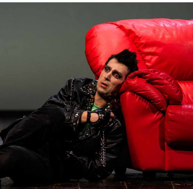
Bohème con i vincitori della edizione 2022 Regia di Gianmaria Aliverta

Il regolamento del Concorso ha valore legale nel testo in lingua italiana. In caso di contestazione è competente il Foro di Milano. Ai sensi dell'art. 10, I comma, della legge 31/12/96 n. 675, i dati personali forniti dai candidati saranno raccolti presso VoceAllOpera ai fini della gestione del Concorso. L'interessato gode dei diritti di cui all'art. 13 della citata legge.