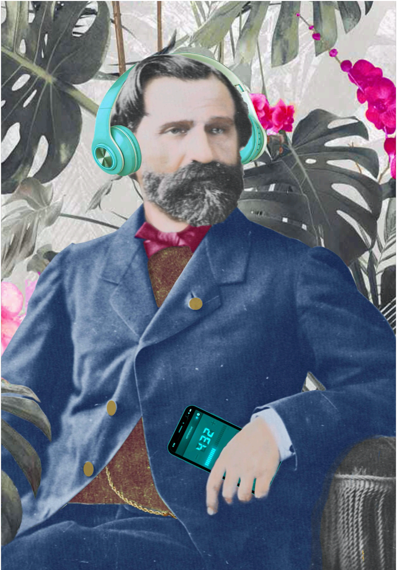
Collage by Adriana Renna