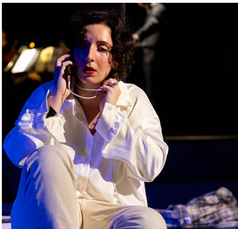
Dittico Traviata / La voix humaine Progetto vincitore della seconda edizione Regia Alessandro Pasini