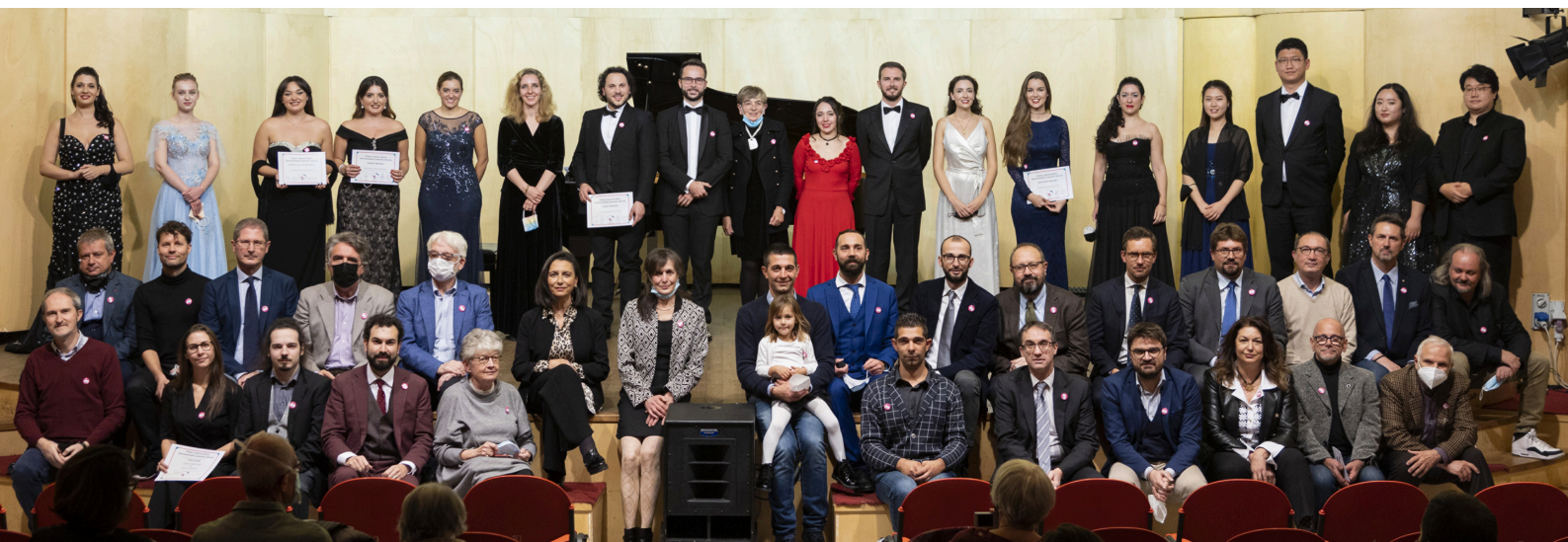
Finalisti e commissione della prima edizione del Concorso Lirico Giancarlo Aliverta allo SpazioTeatro89 il 7 novembre 2021

* l'organizzazione potrebbe variare la sede per alcune parti delle fasi del concorso, che verranno di volta in volta comunicate agli iscritti.