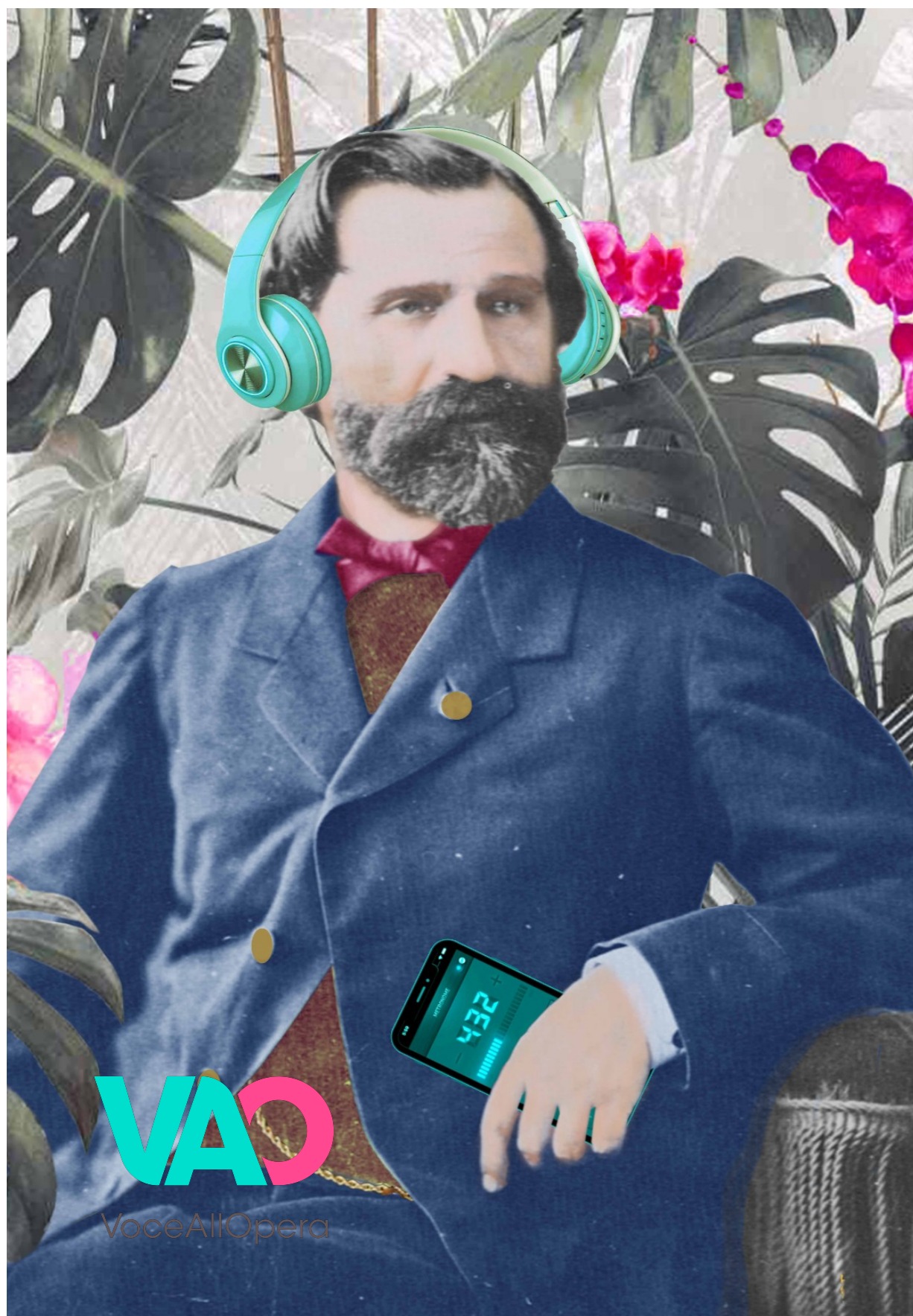
Collage by Adriana Renna